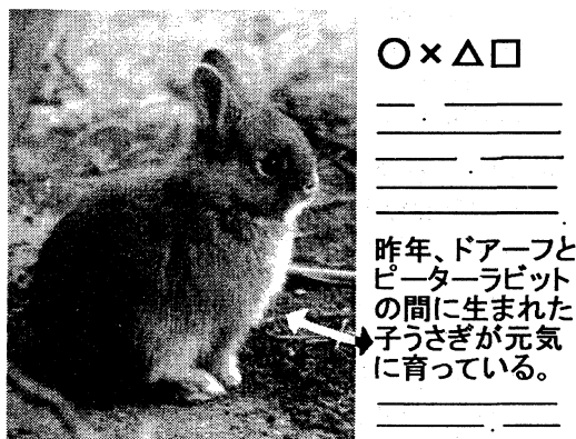
図1: 画像と対応するのはテキストの一部

新聞記事では、当然、写真と記事本文の間には意味的な関係があるのだが、本文と写真が直接対応しているのではない。新聞記事においては写真は補足情報としての意味合いが強く、写真に写っているモノ(あるいはコト)と対応する語句は本文のほんの一部分である。この点で、百科事典における図と本文や、写真とキャプションとの関係とは異なっており、まず写真と対応する語句を特定することが必要である。