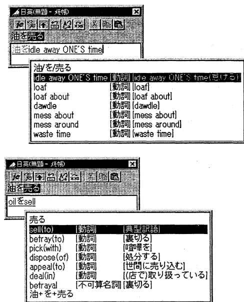
図2 慣用表現の日英変換例

これに加えてここでは、「油/を/売る」という 1) を含まない日本語表示部分を選択することで、慣用表現ではない文字通りの意味も選択することができるようになる。マウス操作やカーソルキーで「油/を/売る」を選択すると、図2の下のように「油」と「売る」が個別に変換される。また逆に、この状態から「油+を+売る」という 2) を含まない日本語部分を選択することで、容易に慣用表現としての訳語を再度選択することができる。