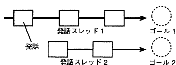
図 2: 発話スレッド