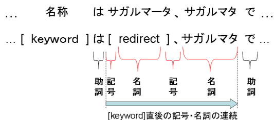
図 2: keyword 直後の名詞・記号の連続文字列の抽出例

初めに、上述した名詞キーワードの直前直後の名詞・記号の連続文字列を抽出する。名詞キーワードの前方、後方の形態素を順にチェックしていき、一番初めに出現する名詞・記号の形態素から、次に出現する名詞・記号以外までの形態素の連続を、文字列として抽出する。次にその文字列を読点で区切り、得られた文字列が [redirect] であればエントリ名とリダイレクト名を