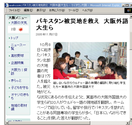
図1: 旧大阪外国語大学のパキスタン震災救援協力について伝える朝日新聞社 Web ページ

この学生らの自発的な活動の成果を継承発展させるため、2007年より本研究グループが中心と