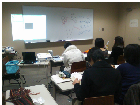
図 6: 構築したウルドゥー語データとアプリケーションを授業中に紹介している様子