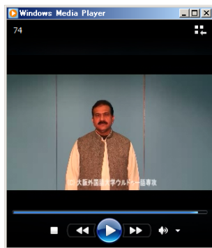
図 5: ウルドゥー語動画データのキャプチャ画面